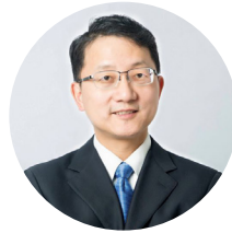
ليکنه: په افغانستان کې د چين لوی سفير؛ ليو جين سونگ

د ټاکنو شريک اړخونه؛ مدني ټولنې، هغه نوماندان چې د ولس رايې ته درناوی لري او نړيواله ټولنه بايد له ټاکنيزو کمېسيونونو سره مرسته وکړي چې له بايومبټريک پرته کارول شوې رايې تشخيص او باطلې اعلان کړي. په دې ډول به له يوه لوري د ټاکنو د پايولو له مشروعيت سره مرسته شوې وي او له بل لوري به د راتلونکو ټاکنو نوماندانو ته څرگند پيغام ورکړل شوی وي چې که سياسي اراده موجوده وي، د درغلی مخنيوی ممکن دی. يوازې د نه بايومبټريک شويو رايو په باطلولو سره هم ټولې ستونزې نه شي حل کېدای. د ټاکنيزو شکايتونو کمېسيون بايد ټولو مستندو شکايتونو ته لازمه او پر وخت رسيدگي وکړي.