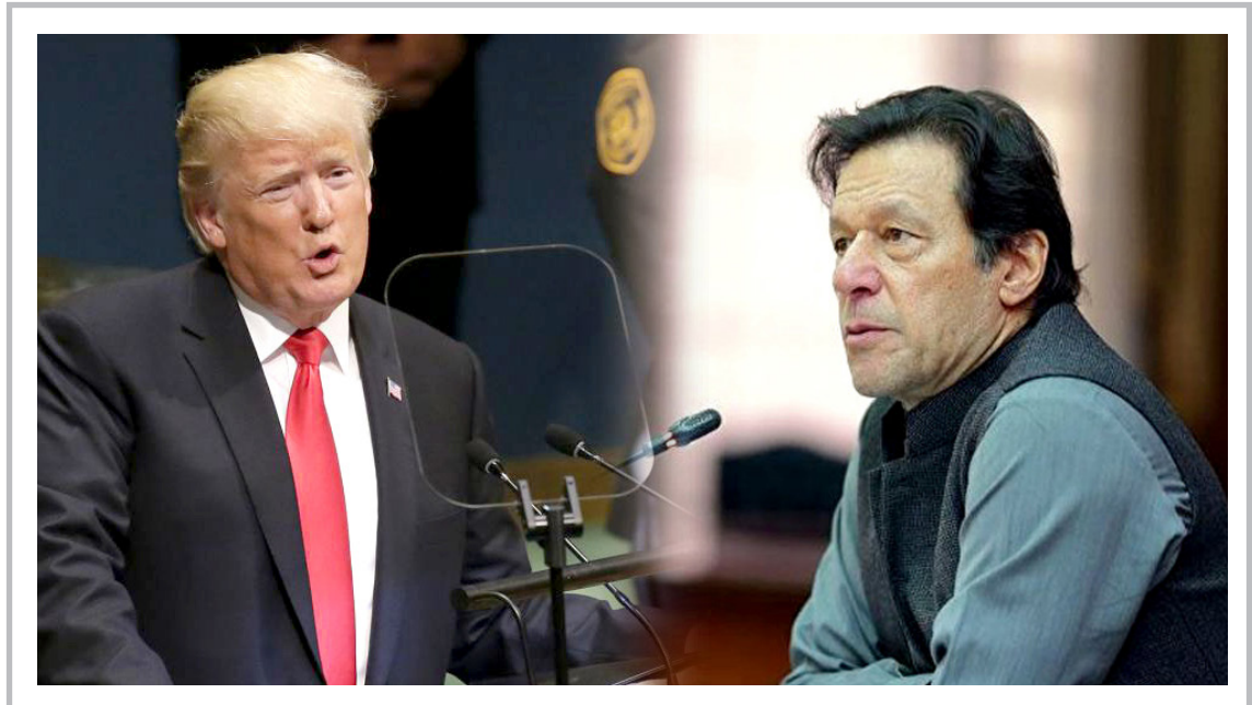
په داسې حال کې چې امریکا په افغانستان کې د جگړې د پای ته رسولو لپاره هڅې پیل کړې، تازه د متحده ایالتونو ولسمشر ډونالد ټرمپ