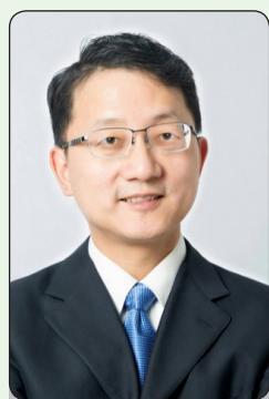
په افغانستان کې د چین لوی سفیر لیو جین سونګ

گرانو افغانانو، یو کال کېږي چې زه افغانستان ته راغلی يم. زه له زړه احساسوم چې دا یو په زړه پورې او ښه ځای دی. خلک یې ډېر مېرني، صادق او رښتیني دي. د افغانستان د بېلابېلو برخو وتلي او ښه شخصیتونه له چین سره د زړه له کومې دوستي او مینه لري. د چین د اصلاحاتو او ورځلاصون د لاسته راوړنو لوړه ستاینه کوي او هیله لري چې چین د یو لوی هېواد په توګه د افغانستان په بیارغونه کې مهم رول ولوبوي. دغه څه پر ما باندې تاثیر کړی او زما له هڅونه کوي. دا هم د چین او افغانستان ترمنځ د اړیکو د پرمختګ خوځنده ځواک دی. ۲۰۱۹ میلادي کال د افغانستان د خپلواکۍ له سلمې کلزې او هم د چین ولسي جمهوریت د جوړېدو له اوایمي کلزې سره برابر دی. د دواړو هېوادونو د خپلواکۍ او ملي ازادۍ د یادونې په وخت کې، زه د زړه له کومې هیله لرم چې په افغانستان کې ژر سوله او ثبات رامنځته شي، د افغانستان د ملي جوړجاړي بهیر بریالی شي او هغه مهم سیاسي جریان په ثابته توګه روان او تر سره شي، کوم چې د افغانستان خلک غواړي او په هغه کې یې برخه خپل حق دی. د چین او افغانستان د خلکو زړونه تل سره تړلي او یو له بل سره مرسته کوي. چین د افغانانو تر لارښوونې او مالکیت لاندې د سیاسي روغې جوړې او پخلاینې له جامع جریان څخه ټینګ ملاتړ کوي او په دوامداره توګه به د افغانستان د سولې او پرمختګ لپاره رغنده رول ولوبوي. نوی کال مو مبارک شه، نېکمرغه اوسئ، تل دې وي د چین او افغانستان ترمنځ دوستي!