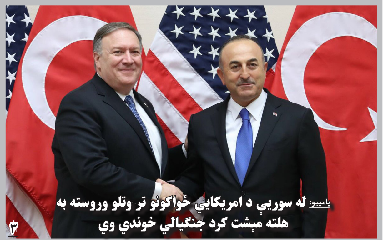
پامپیو: له سوریې د امریکایي ځواکونو تر وتلو وروسته به هلته مېشت کړد جنګیالي خوندي وي

در همین حال، شورای عالی صلح، نقش ملابردار را در گفت وگوهای صلح بسیار مهم می داند و از طالبان می خواهد که هیئت گفت وگوکننده شان را با حکومت افغانستان، مشخص بسازند.