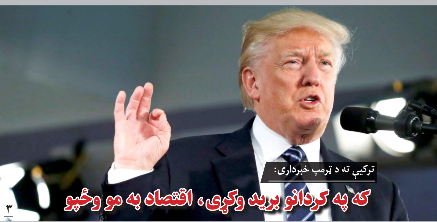
ترکیبی ته د ټرمپ خبرداری:

وی خطاب به وزارت‌های اطلاعات و فرهنگ، تحصیلات عالی و معارف گفت که باید تصوف در نصاب فرهنگی افغانستان جا داده شود.