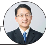
ليکنه: په افغانستان کې د چين لوی سفير ليوجين سونگ

د سپر کال د جنورۍ ۲۰مه د چين او افغانستان ترمنځ د رسمي اړيکو د ټينگېدو له ۶۴مې کليزې سره برابره ده. له ۶۴ کلونو راهيسې، هرڅومره که نړيوالو حالاتو او کورنيو چارو بدلونونه کړي دي، خو د چين او افغانستان ترمنځ اړيکې تل نږدې پاتې شوې دي او له گاونډيو هېوادونو سره د چين د اړيکو د يوې نمونې په توگه بلل کېږي، چې ور څخه د نويو نړيوالو اړيکو او د گډ برخليک د ټولنې په اړه مفکورې څرگندېږي.