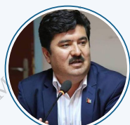
عنایت الله حفیظ