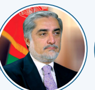
ډاکټر عبدالله عبدالله