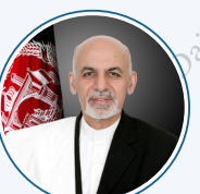
ډاکټر محمد اشرف غني