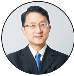
لیکنه: په افغانستان کې د چین لوی سفير لیو جین سونگ

ولسمشر ته پکار ده چې د ناسمو او هوايي خبرو پر ځای ولس ته رښتیني معلومات ورکړي، څو د سترو زیانونو مخه ونیول شي. رښتیا دا دي چې د سولې پروسه د حکومت له کنټرول څخه بهر ده، امریکا یا ونه غوښتل او یا یې ونه شو کولی چې طالبان له حکومت سره خبرو ته کېږي. رښتیا دا دي چې د پاکستان او امریکا ترمنځ معامله روانه ده. رښتیا دا دي چې د سولې په پروسه کې تر نورو ټولو اړخونو افغان حکومت منزوي او بي خبره دی. که ولسمشر خلکو ته رښتیني معلومات ورکړي، نو خلک بیا حالت بدلولی شي، د ناوړه معاملو مخه نیولی شي او د سولې هڅې رښتیني مسیر ته برابرولی شي.