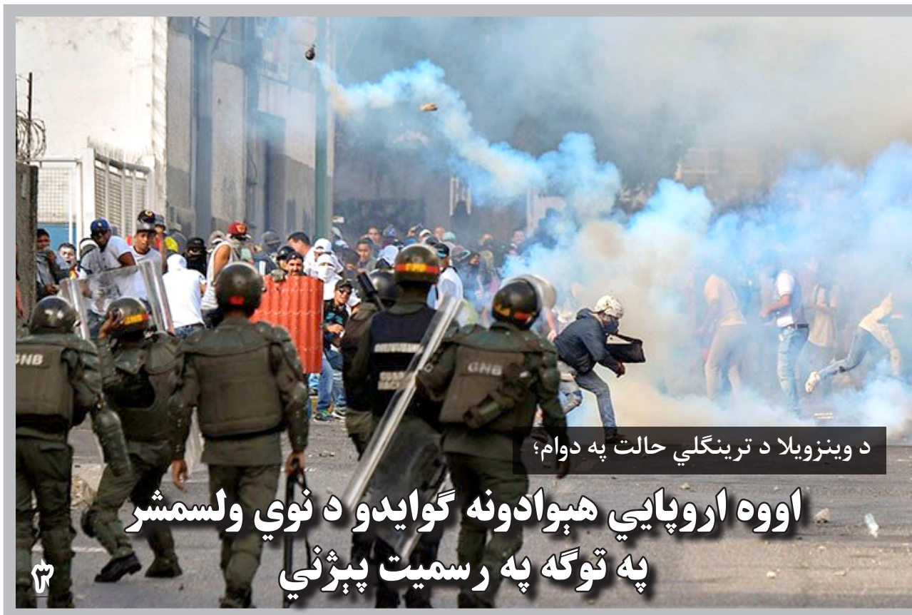
د وینزویلا د ترینگلی حالت په دوام؛

اما رئیس جمهور غنی گفته است که صلحی که نقش نیروهای امنیتی افغانستان در آن نادیده گرفته شود، قابل پذیرش نیست. او یک بار دیگر بر مبارزه با طالبان تأکید کرده و افزوده است که این گروه نباید فکر از هم پاشی اردو را درس داشته باشند. وی افزوده است: «آنانی که دیگران را به زور به مذاکرات می‌کشاند، در خصوص از هم‌پاشی شیران ما صحبت نمی‌کنند، اگر این قدر شهامت دارند، به جای انتحار و انفجار در میدان جنگ، زور آزمایشی کنند».