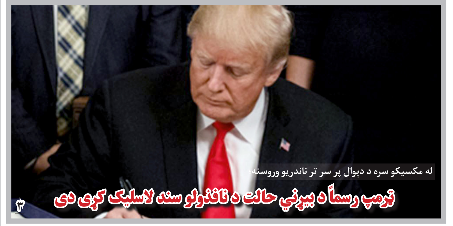
له مکسیکو سره د دېوال پر سر تر ناندريو وروسته