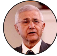
ليکنه: عبدالباري جهاني - درېيمه برخه:

اوس چې ښکاري طالبان د حکومت لېست ردوي، نو د دې شونتيا هم شته چې غونډه وځنډېږي او بيا هم لغوه شي؛ خو تر دې دا شونتيا ډېره ده چې غونډه وشي او گډونوال يې ډېری هغه کسان وي، چې نومونه يې څو ورځې وړاندې په لومړني لېست کې خپاره شوي وو او دغه نومونه قطري پلاوي له خان سره کابل ته راوړي وو.