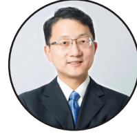
لیکنه: په افغانستان کې د چین لوی سفیر لیو جین سونگ