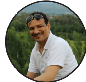
ليکنه: مشتاق رحيم