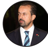
نوسينده: اوغوزخان ارطغرل سفير کبير جمهوري ترکيه در افغانستان

د ملکي وگړو وروستی مرگ ژوبله په هېڅ ډول د زغم وړ نه ده. خلک به يې پر وړاندې چوپ پاتې نه شي او هغوی چې له خلکو سره په دغه دښمنۍ کې ښکېل دي، د دغو وحشتونو درنه بيه به پرې کړي.