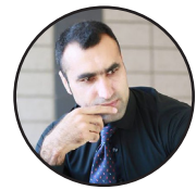
لیکنه: انتظار خادم