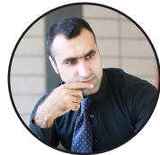
ليکنه: انتظار خادم

زموږ حکومت لا هم د معلوماتو پر ځای تحليل کوي او هغو گواښونو ته پام نه کوي چې له دغه بدلون سره تړلي دي. پکار ده چې د امريکايي ځواکونو د وتلو مسئله جدي وگڼل شي. که ټول ځواکونه هم ونه وځي، همدا چې د ځواکونو وتل پيل شي، دا به پر افغانستان او افغان حکومت ژور اغېز پرېږدي. دې چارې ته بايد د يو فرصت په سترگه هم وکتل شي، د امريکايانو د وتلو هرکلی دې وشي، خو ورسره سم بايد داسې گامونه واخيستل چې د افغانانو ترمنځ فاصلې را کمې شي. کله چې د ځواکونو وتل پيلېږي، نو ورسره به اوربند کېږي او بيا به هم جگړه کېږي چې دا يوه بدلون دی او پوره گټه بايد ترې واخيستل شي. له بده مرغه داسې نه ښکاري چې حکومت به دې چارې ته پام کوي او گټه به ترې اخلي. دلته چارواکي لا هم فکر کوي چې ټاکنې به کېږي، دوی به يې گټي او پنځه کاله به بيا دوی پر افغانستان واکمني کوي.