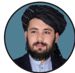
لیکنه: قاضي نجیب الله جامع

له همدې امله افغانان باید د امریکایي چارواکو او نورو سیاستوالو ناوړه خبرو ته عملي غبرگون ونښي. عملي او معقول غبرگون دا دی چې له خپل افغان ورور سره دښمني پرېږدو، یو بل ته لاس ورکړو او ټول په گډه د امریکایي دسیسو او شومو پلانونو پر وړاندې ودرېږو. همدا شعوري او عملي غبرگون دی. له دې پرته غبرگونونه بې گټې احساسات دي چې زموږ ستونزې نه حلوي.