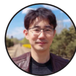
لیکوال: شي مونگ د چین نړیوالې راډیو د پښتو څانگې مشر