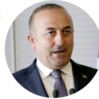
نوسینده: مولود چاووش اوغلو وزیر امور خارجه جمهوری ترکیه

تر هغو چې مور سیاسي خپلواکي پیدا نه کړو، تر هغو چې بهرنی سفیران او ډیپلوماتان زموږ په ټاکنیزو کمپسیونو کې گرځي را گرځي، ټاکنې او د خلکو رایه مانا نه لري. له همدې امله د سیاسي خپلواکۍ لپاره باید کار وشي. د سیاسي خپلواکۍ لپاره اساسي لاره له وسله والو مخالفینو سره سوله او سیاسي جوړجاړی دی. دا جوړجاړی باید د بهرنیو ځواکونو وتلو، د سیاسي او نظامي مداخلې بندېدو او سیاسي خپلواکۍ ته لاره هواره کړي. هغه وخت به بیا ټاکنې او د خلکو رایه خپل ارزښت پیدا کړي.