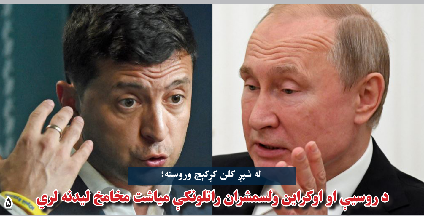
له شپړ کلن کړکېچ وروسته؛

بربنیاد آمارها، در حدود شش میلیون مهاجر افغان در ایران زنده گی می کنند. از این میان، در حدود سصد هزار تن آنان به گونه غیرقانونی در ایران پناهنده هستند.