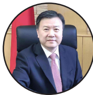
لیکنه: وانگ یو، په افغانستان کې د چین لوی سفیر

له بده مرغه پر ټاکنو ټینګار، ټاکنیزې لانجې او بیا په دغو لانجو کې د سیاستوالو او حکومت ښکېلتیا د دې سبب شوې چې موږ هم د سولې په برخه کې فرصتونه له لاسه ورکړو او هم په دې برخه کې په کېدونکو معاملو او هوکړه کې څنګ ته پاتې شو. د بې مانا او بې ارزښته ټاکنو لانجه باید نوره ختمه شي او دا چې پېټر باید یو مخ وتړل شي. پکار ده چې سیاستوال او حکومت پر سوله ټینګار وکړي، واحد دریځ پیدا کړي او په گډه د سولې لپاره کار وکړي. له دې پرته د امریکا او طالبانو معامله کېدونکې ده او هوکړه به لاسلیک کوي. بیا به سیاستوال هرو مرو تاوان کوي او ښایي ولس هم تاوان وکړي. له همدې امله پکار ده چې پر سوله تمرکز وشي، ملاتړ یې وشي او له طالبانو سره د جوړجاړي او گډ راتلونکي لپاره پیاوړي گامونه واخیستل شي.