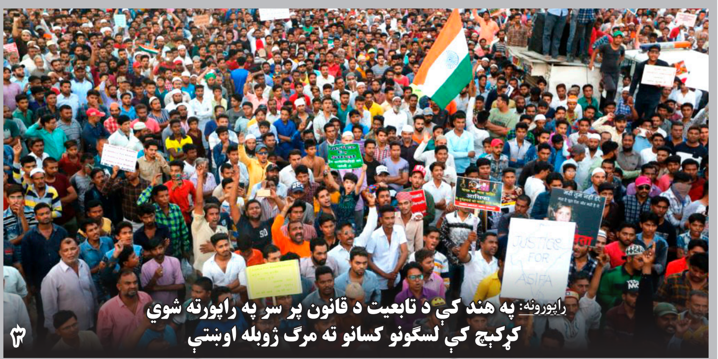
رپورونه: په هند کې د تابعیت د قانون پر سر په راپورته شوي کړکېچ کې لسگونو کسانو ته مرگ ژوبله اوښتې