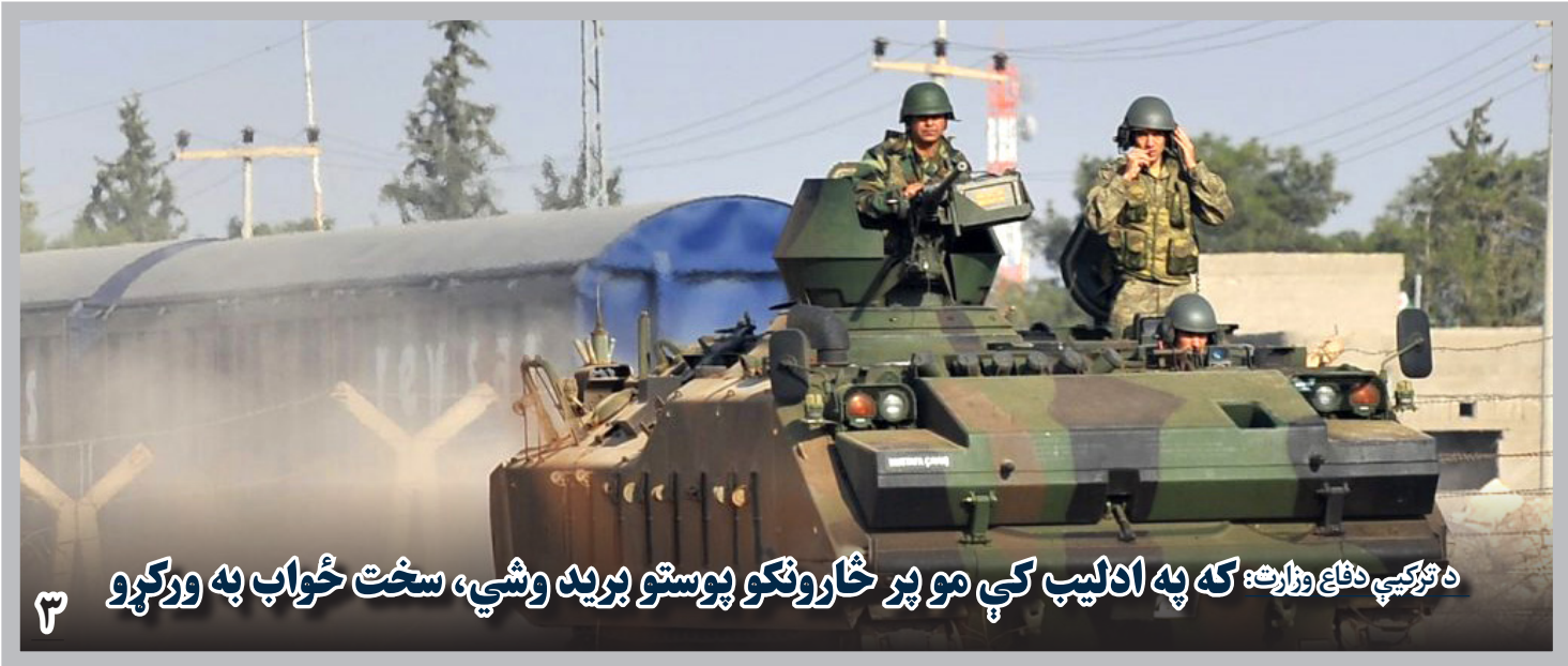
د شرکې دفاع وزارت: که په ادلیپ کې مو پر څارونکو پوستو برید وشي، سخت ځواب به ورکړو