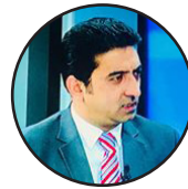
ليکنه: شفيق همدرد

maseerdaily@gmail.com 0202502100 / 0777989696 www.maseerdaily.af Maseer Daily MaseerDaily