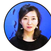
ليکواله: ډېوه- د چين نړيوالې راډيو خبرياله