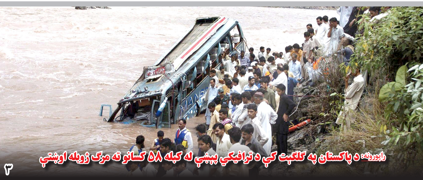
راپورونه: د پاکستان په کلکت کې د ترافیکي پېښې له کبله ۵۸ کسانو ته مرگ ژوبله اوښتې

مجاهد گفته است، دیدار مقامات زندان‌های دو طرف روز شنبه و یکشنبه در دوحه صورت گرفت که نخستین ارتباط مقامات دولت افغانستان و طالبان از زمان امضای توافق خروج در ۲۹ فبروری بود.