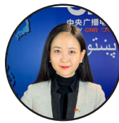
ليکواله: غوثی د چين نړيوالې راډيو د پښتو څانگې خبرياله

ځينو نورو کارونو ته به هم اړتيا وي، خو دا هغه گامونه دي چې حالت ښه کولی شي، د گواښ او خطر مخه نيولی شي او خلکو ته بېرته هيله ورکولی شي. له دې پرته مور په واقعي مانا ناوړه حالت ته روان يو او لاملين يې هم د افغانستان خلکو ته معلوم دي.