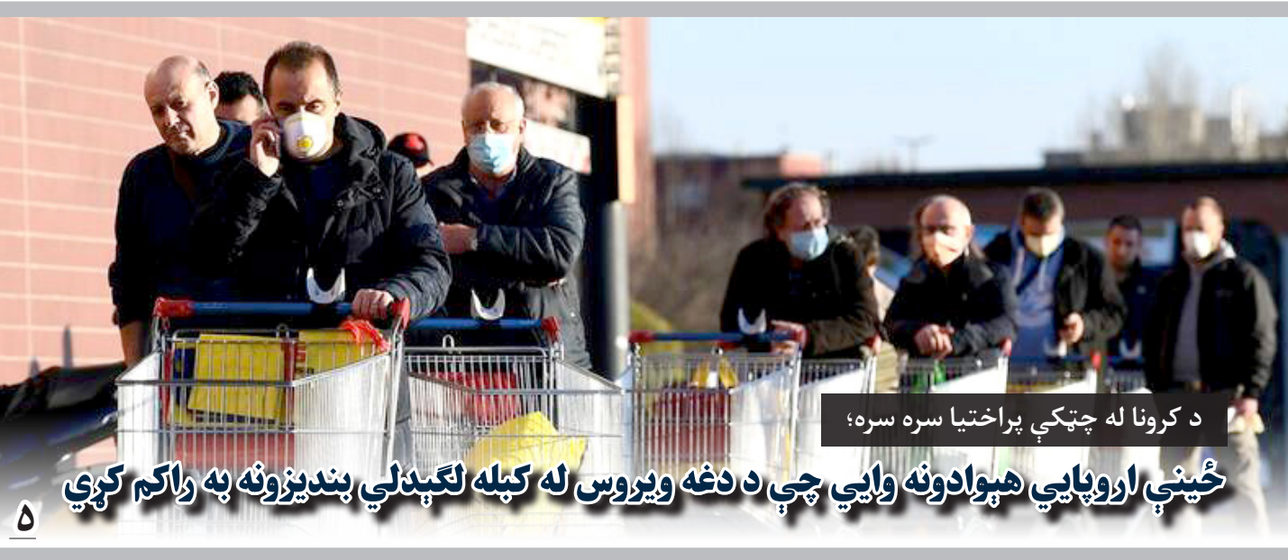
د کرونا له چټکې پراختیا سره سره؛

رهایی زندانیان طالبان پیش شرطی برای آغاز گفتگو های صلح گفته شده است، اما اکنون این روند با انتقاد های روبرو است.