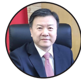
نویسنده: وانگ یو؛ سفیر کبیر جمهوری مردم چین مقیم افغانستان

په افغانستان کې پر کرونا ویروس د اخته کسانو ثبت شوې شمېرې څه کم دريو زرو ته رسېدلې دي، خو ویل کېږي چې ډېر نور کسان هم پر دغه ویروس اخته دي، خو روغتونو ته مراجعه نه کوي. له دې سره حکومت تر کوچني اختر پورې د کرنیتین د غځولو پرېکړه هم کړې ده. د کرنیتین له اوږدېدو سره لوړه زیاته شوې او اقتصادي حالت ورځ تر بلې خرابېږي.