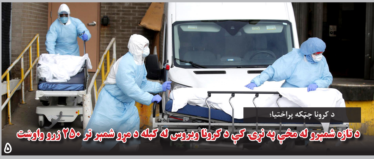
د کرونا چټکه پراختیا؛ د تازه شمپرو له مخې په نړۍ کې د کرونا ویروس له کیله د مرو شمپر تر ۲۵۰ زرو واوښت