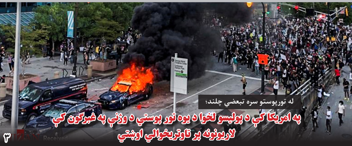
له تور پوستو سره تبعضي چلند؛

این در حالیست که سال گذشته نیز به تاریخ ۱۵ ماه می موتر حامل کارمندان این تلویزیون در سرک پنجم تایمنی شهر کابل هدف انفجار ماین مقناطیسی قرار گرفت که بشمول یک رهگذر دو تن کشته و سه تن زخمی شدند.