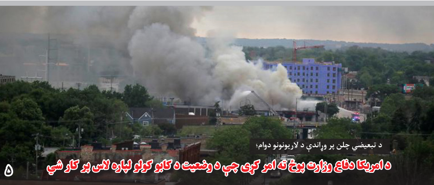
د تبعیضي چلن پر وړاندې د لاریونونو دوام؛

سفارت های ایالات متحده آمریکا، بریتانیا در کابل و شماری از نهادهای خارجی دیگر نیز حمله بر موتر حامل کارمندان تلویزیون خورشید را نکوهش کرده اند. سفارت آمریکا در کابل، گفته است که حمله بر خبرنگاران، حمله بر آزادی بیان است و سفارت بریتانیا نیز تأکید کرده است که پشتیبانی اش از خبرنگاران در افغانستان را ادامه می دهد. این در حالیست که دو روز پیش در حمله بر موتر حامل کارمندان تلویزیون خورشید دومین حمله است که در دو سال اخیر صورت می گیرد. سال گذشته نیز موتر کارمندان این تلویزیون آماج یک انفجار قرار گرفت. مسؤلان تلویزیون خورشید با ابراز نگرانی از آماج قرار گرفتن خبرنگاران و کارمندان رسانه ای در کشور، می گویند که نهادهای امنیتی برای بررسی چنین رویدادهای توجیه ندارند.