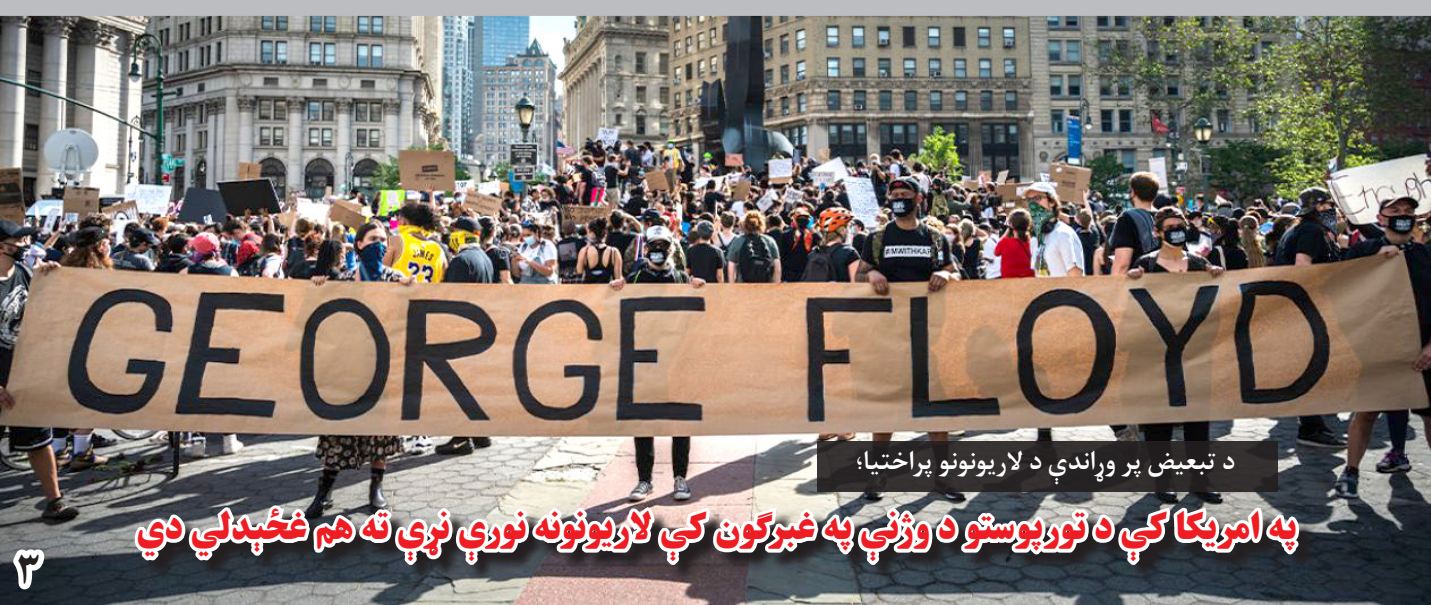
د تبعیض پر وړاندې د لاریونونو پراختیا؛

میک می گوید که هرچند وزارت داخله ۳۵ سفارش آنان را کاملاً تطبیق کرده، اما هنوز هم از نداشتن پالیسی بهترین روش برای بازسازی سیستمهای دوسیه بندی وسوابق، نبود میکانیزم مناسب برای ظرفیت سازی و نبود کنترل بر مدیریت قراردادهای و نظارت از پیشرفت در عملی شدن آنها رنج می برد. کمیته مستقل مشترک نظارت و ارزیابی مبارزه علیه فساد اداری (میک) دیروز ۱۲ جوزا، سومین گزارش نظارتی خویش پیرامون وضعیت تطبیق سفارشات مبارزه با فساد اداری را که در گزارش ارزیابی آسیب پذیریهای فساد اداری در وزارت امور داخله آورده شده است، نشر کرد. گزارش ارزیابی آسیب پذیری های فساد اداری در فروردین ۲۰۱۹ به منظور شناسایی این آسیب پذیری ها در عملکردهای مهم وزارت داخله هم چون مدیریت منابع بشری، تدارکات و لوجستیک تهیه و به نشر رسید. میک طی این گزارش ۵۶ سفارش را برای اصلاحات به این وزارت پیشنهاد نمود که تا تاریخ ۲۶ ثور ۱۳۹۹، وزارت داخله ۳۵ سفارش (۶۳ درصد) را کاملاً تطبیق نموده و ۱۰ سفارش دیگر (۱۸ درصد) را قسماً تطبیق کرده و همزمان، ۱۱ سفارش باقیمانده (۲۰ درصد) باقیمانده به چندین دلیل آشفته شده اند. یافته های عمده در وزارت داخله نشان میدهد که سیستم پرداخت معاشات کارکنان افغانستان در این وزارت در حال تطبیق شدن است، در حالی که صلاحیت تشکیل و مادلهای (طرح) استخدام این سیستم بالای همه کارمندان جدید اعمال میگردد. تا تاریخ ۱۵ می ۲۰۲۰، سوابق ۸۲۷،۱۲۲ کارمند در سیستم ادغام گردیده و واجد شرایط پرسوس معاشات می باشند.