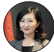
لیکواله: ډېوه د چین میډیا ګروپ د پښتو څانګې خبریاله

له یوه اړخه حکومتی مشران په سیاسي معاملو بوخت دي، حکومت او حکومتوالي یې مسخره کړې، له بله اړخه ولسي جرگې ته هم داسې وکیلان راغلي چې خپله دنده ترې هېره ده او پر خپلو سوداګریو، معاملو او کیسو بوخت دي. په دوی کې ځینې یې کله کله له حکومت څخه د کانديد وزیرانو د ورپېژندنې غوښتنه وکړي، خو اکثریت یې غلي دي او داسې حالت یې غوره کړی، لکه دا چې د دوی دنده نه وي او یا هم د حکومت یو داسې اداره وي چې هر څه ارگ کوي، دوی یې باید ومني او پرې غلي شي. د بې کفایتې، معاملګرې، د ولس له دردونو او ستونزو د ناخبره ولسي جرگې موجودیت د دې سبب شوی چې حکومت لایزات په دې برخه کې بې توپیره شي او همداسې په ناقانونه ډول واک وپوښي او اکثریت وزارتونه د سرپرستانو په وسیله رهبري کړي. که ولسي جرګه مسوولانه عمل وکړي، د حکومت چلند به بدل شي، کابینه به ژر تکمیل شي، د ناوړه وزیرانو مخه به ونیول شي او ور کسان به راوړل شي، خو که ولسي جرګه همداسې وي، نو کیسه لا خرابېږي. حکومتی مشرانو ته پکار ده چې نور پر دې ولس رحم وکړي. کله یې چې واک په ناقانونه ډول وپوښه، اوس باید دواړه اړخونه ژر له خپله اړخه وړ، مسلکي، په کارپوه، ژمن او صادق خلک معرفي کړي چې له ولسي جرگې د باور رایه واخلي. دوی ته پکار ده چې په دې چاره کې بېرته وکړي، ځکه اوسنی حالت او د سرپرستانو له خواد وزارتونو رهبرۍ نه یوازې د حکومت پر کړنو ناوړه اغېز کړی، بلکې فساد او ګډوډۍ یې هم زیاتې کړي دي او اصلي زبان یې ولس ته رسېږي.