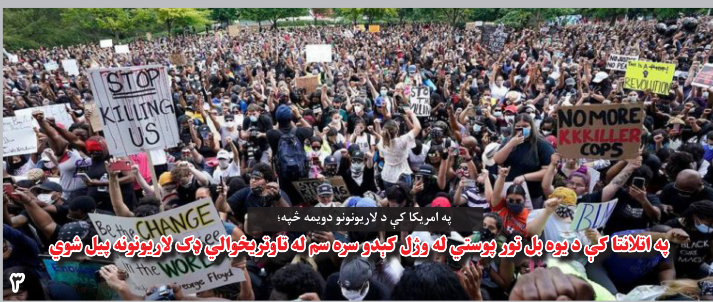
په امریکا کې د لاریونونو دویمه څپه؛ په اتلانتا کې د یوه بل تور پوستي له وژل کېدو سره سم له تاوتریخوالي ډک لاریونونه پیل شوي