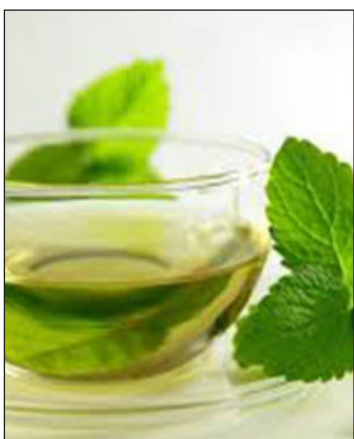
کېدای شي ځینې کسان یې له څښلو سره حساسیت ولري.

د نعنا چای پر روغتیا او ښایست سربېره، د سټرېس له کموالي سره مرسته کوي. دغه چای چې د نعنا له پاڼو جوړېږي، د نور معمولي چای برعکس کافین هم نه لري، نو هغه کسان چې د بې خوبۍ ستونزه لري، کولی شي په ډاډه زړه یې له خوبه مخکې هم وڅښي. دا چې ډېر ښه خوند او بوی لري، نو نن سبا یې د نړۍ د تر ټولو ښه چای ځای هم خپل کړی دی. دغه چای وزن کموي، بې خوبی له منځه وړي، تمرکز مو پیاوړی کوي، تنفسي ناروغۍ له منځه وړي، تبه پرې کوي، د ناروغیو پر وړاندې د بدن مقاومت لوړوي او د معدې دردونه او میکروب له منځه وړي. څه ډول چې دغه چای گټې لري، نو ځینې جانبي عوارض هم لري.