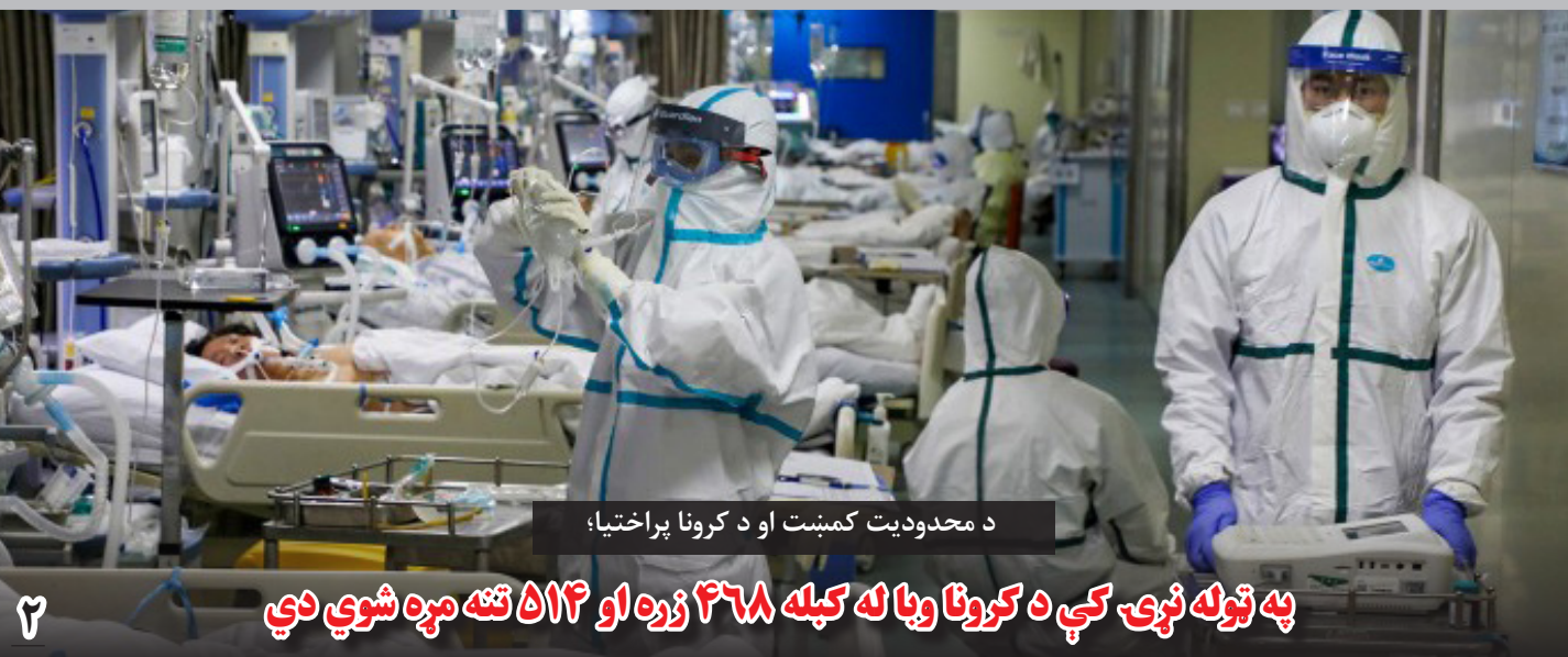
د محدودیت کمبنت او د کرونا پراختیا؛