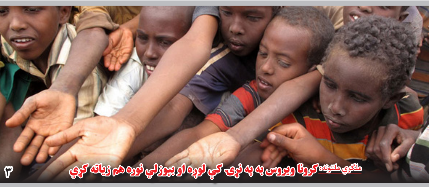
ملگري ملتونه: کرونا ویروس به په نړۍ کې لوړه او بېوزلي نوره هم زیاته کړي