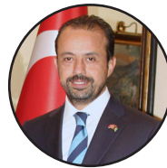
◀ اوغوزخان ارطغرل سفیر ترکیه مقیم افغانستان

د امریکا او طالبانو تر منځ د هوکړې د عملي برخې له دریو پړاوونو یو بشپړېږي، خو لا هم بین الافغاني خبرې نه دي پیل شوې. ټاکل شوې وه چې د تېرې مارچ تر لسمې به پنځه زره طالب بندیان خوشې شي او ورسره به په یوه اونۍ کې بین الافغاني خبرې هم پیل شي، خو دا ده پنځمه میاشت روانه ده، نه پنځه زره طالب بندیان خوشې شوي دي او نه هم بین الافغاني خبرې پیل شوې دي. تر دې د اندېښنې وړ خبره دا ده چې لا هم د خبرو د پیل پر وړاندې ډېر خنډونه دي او ورسره یو ځل بیا جگړه زور اخلي. امریکایان وایي چې هوکړه یې عملي کړې، خپل ځواکونه یې ۸۶۰۰ ته را ښکته کړي دي او له څلورو ولایتونو یې هم خپل ځواکونه ایستلي دي. طالبان بیا امریکا گرمه گڼي چې هوکړه یې نقض کړې او په داسې حال چې دوی پر امریکا هېڅ برید نه دی کړی، خو امریکایي ځواکونو پر طالبانو پرله پسې هوايي بریدونه او عملیات کړي دي. د دې تر څنګ امریکا له دې امله هم گرمه گڼل شوې چې له طالبانو سره یې د بندیدونو په خوشې کولو کې کړې ژمنه نه ده عملي کړې.