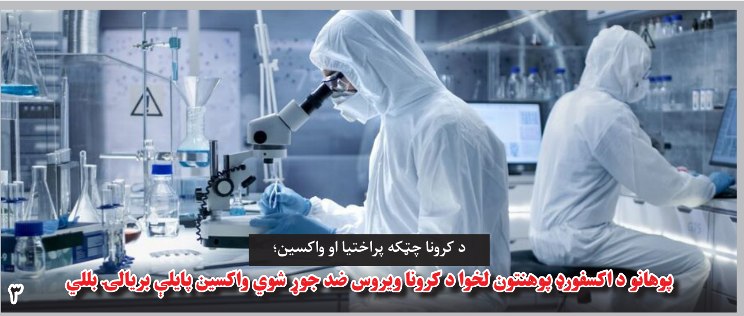
د کرونا چټکه پراختیا او واکسین؛