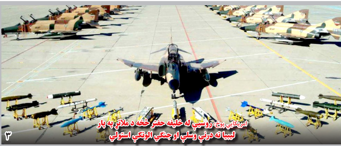
امریکایی پوځ: روسیې له خلیفه حفر څخه د ملاتړ په پار لیبیا ته درنې وسلې او جتې الوتکې استولې