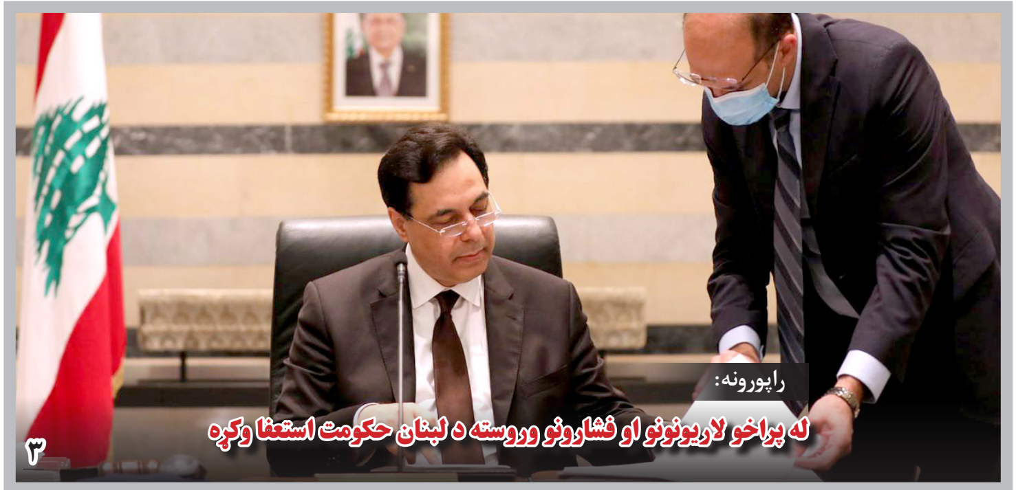
له پراخو لاریونونو او فشارونو وروسته د لبنان حکومت استعفا وکړه