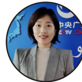
لیکنه: هیله د چین نړیوالې راډیو خبریاله