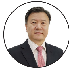
لیکنه: وانګ یو په افغانستان کې د چین لوی سفير

د خبرو پیل د سولې په لاره کې د بریا لپاره یو ستر ګام و، خو د اساسي بریا لپاره پکار ده چې دا خبرې همداسې روانې وساتل شي، پرمختګونه پکې وشي، دواړه لوري پکې انعطاف ونیسي، له خپله اړخه قرباني ورکړي او د سولې لپاره له هر ډول توندو څرګندونو او ناسمو کړنو څخه ځان وساتي. له دې سره هممهاله پر دواړو اړخونو یو ولسي فشار هم پکار دی چې روانې خبرې بریالی کړي او دا جگړه نوره ختمه شي.