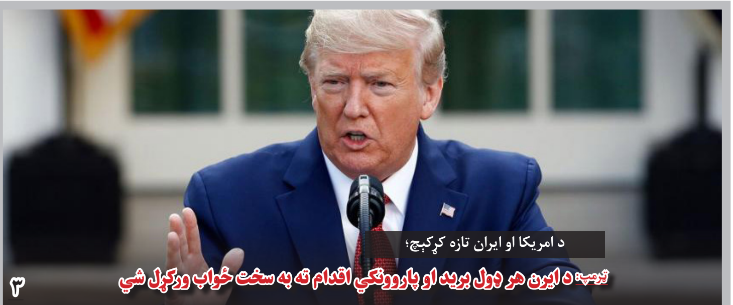
د امریکا او ایران تازه کرکېچ؛