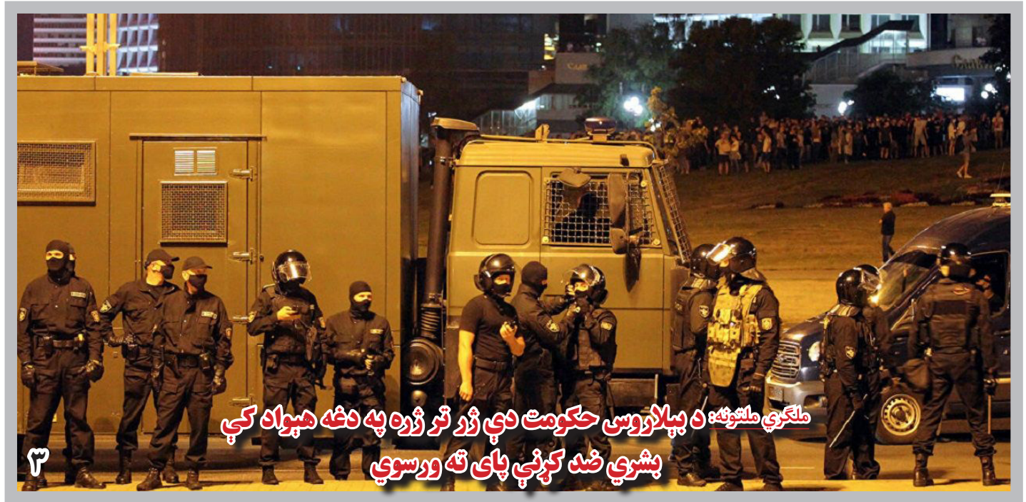
ملگري ملتونه د بېلاروس حکومت دې ژر تر ژره په دغه هېواد کې بشري ضد کړنې پای ته ورسوي