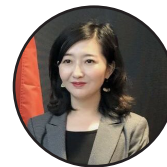
ليکنه: ډپوه د چين ميډيا گروپ د پښتو څانگې خبريال