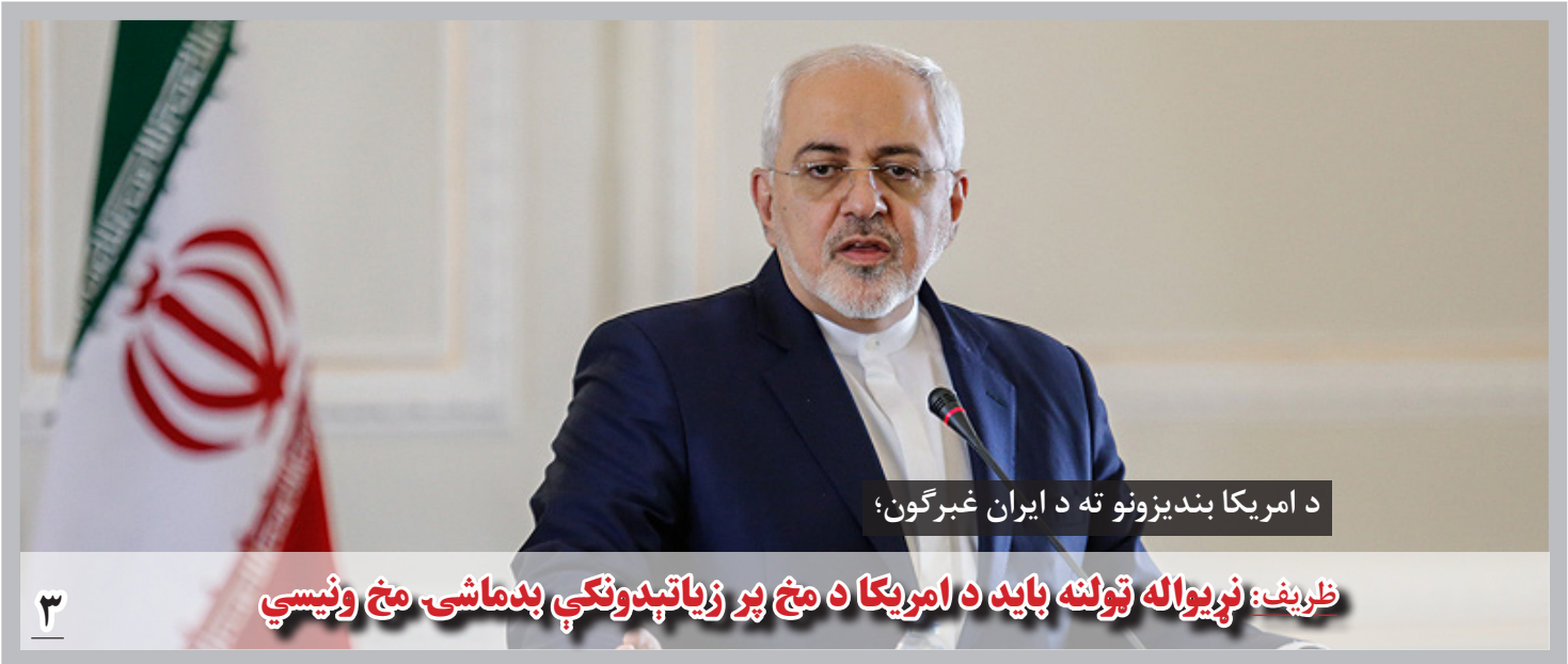
د امریکا بندیزونو ته د ایران غبرگون؛