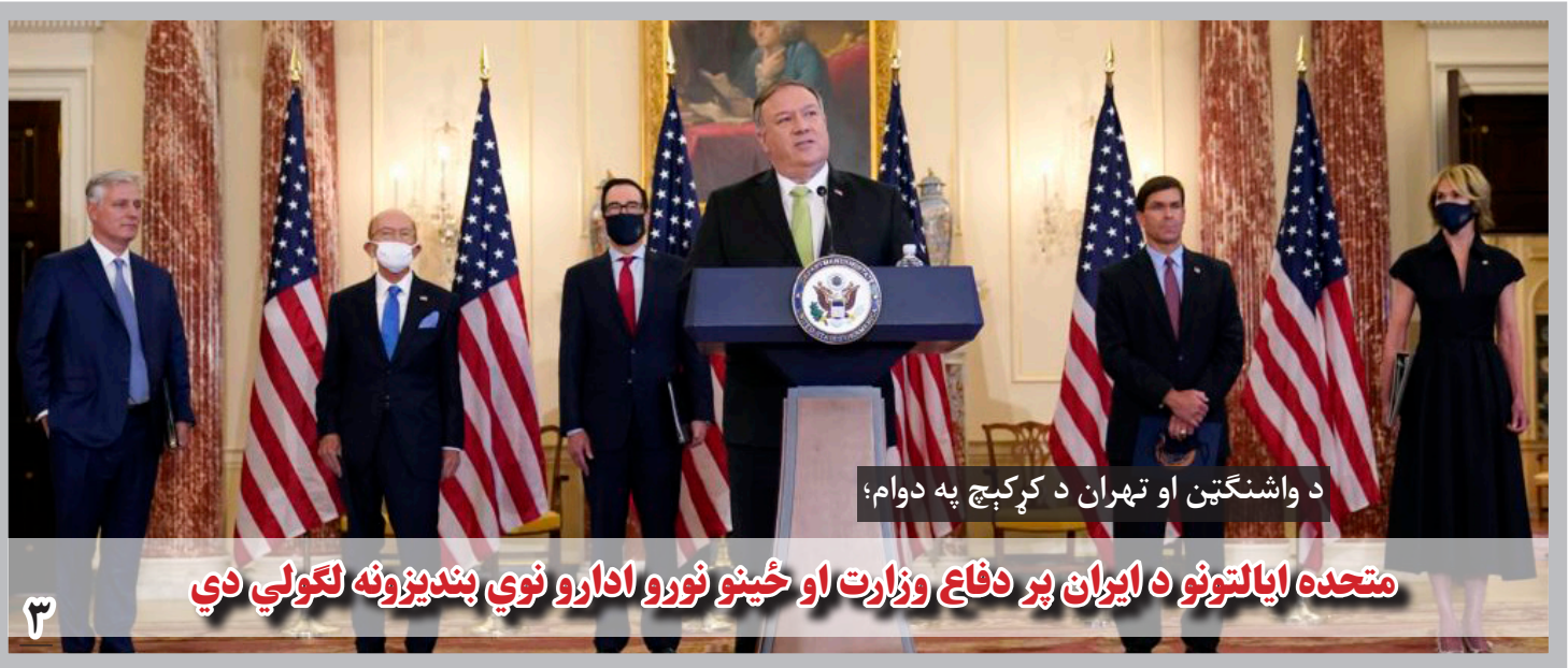
د واشنگتن او تهران د کرکچ په دوام؛

ذبیح‌الله مجاهد، سخنگوی این گروه با پخش اعلامیه‌ای گفته است که معاونان رئیس جمهوری این کشور با چنین اظهاراتی در برابر نظام آینده افغانستان «عقدہ گشایی» می‌کنند.