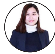
ژباړه: زرينه د چين ميډيا گروپ د پښتو څانگې خبرياله