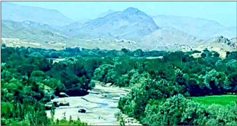
ښه دود دی. کرڼه

په پکتیکا کې که څه هم چې دښتې ډېرې دي او حکومت یې خړوبونې ته پام نه دی کړی، خو بیا هم ۶۵ سلنه وگړي یې په بزگرۍ اخته دي. مشهور کرنیز پیداوار یې غنم، جوار، اوربشې، می او لوبیا دي.