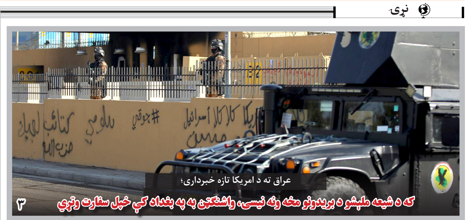
عراق ته د امريکا تازه خبرداري؛