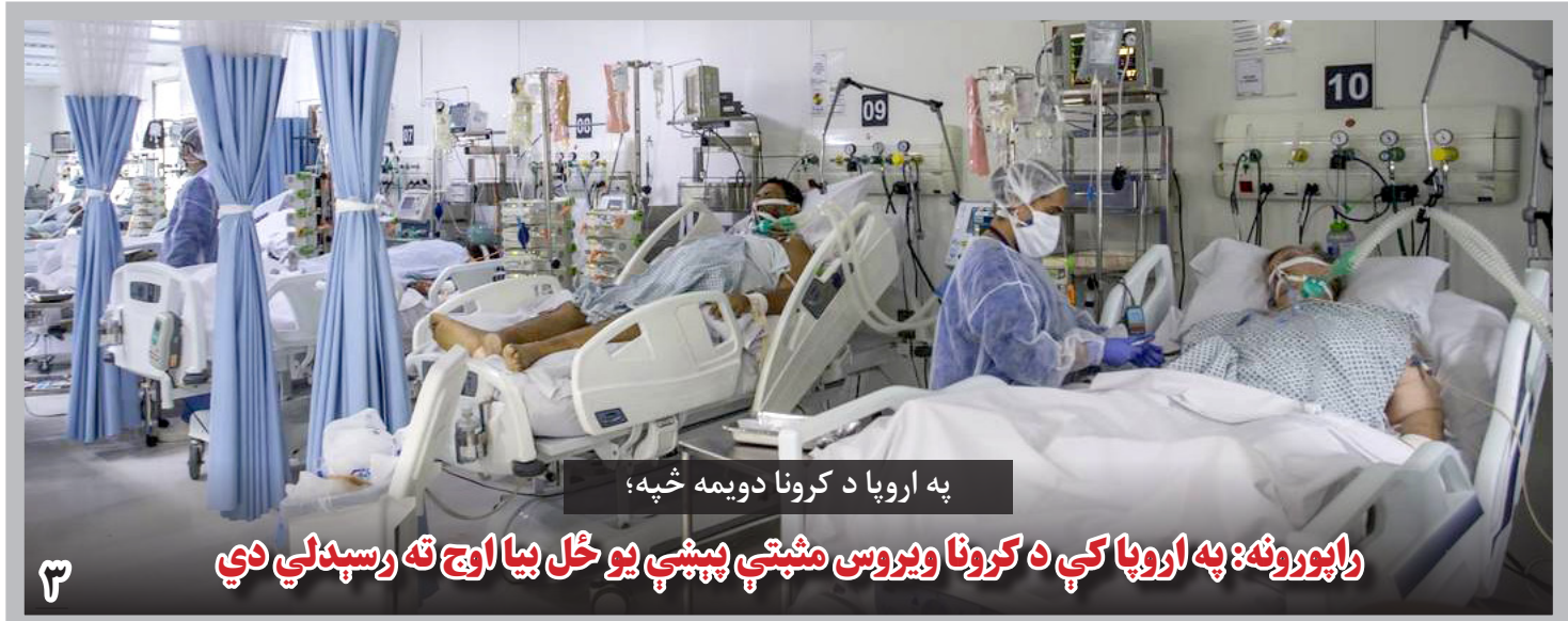
په اروپا د کرونا دویمه خپه؛

فضل هادی مسلمیار رئیس مشرانو جرگه نیز گفت که گزارش ها از ادامه نصب سیم خاردار در خط فرضی دیورند وجود دارد و باید هیأتی از این جرگه، موضوع را از نزدیک بررسی کرده و گزارش آن را با جرگه شریک سازد؛ تا جرگه در مورد تصمیم اتخاذ کند. سرانجام اعضای جرگه با اکثریت آراء فیصله کردند تا کمیسیون های امور دفاعی و امور سرحدات این جرگه، به گونه مشترک، از خط فرضی دیورند دیدن بکنند و در مورد به جرگه گزارش دهند.