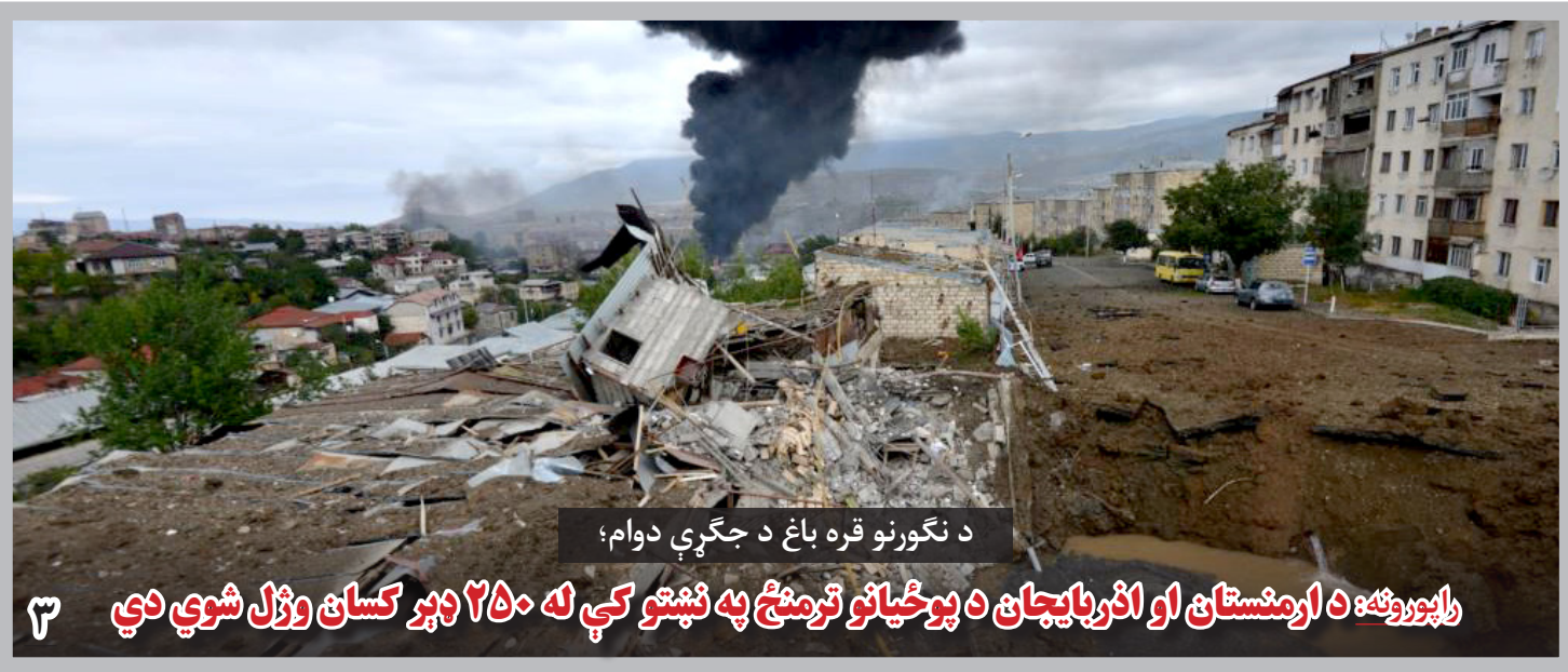
د ننگورنو قره باغ د جگرې دوام؛