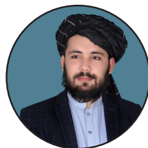
لیکنه: قاضي نجیب الله جامع

په کابل ښار کې اوس هره ورځ د غلاوو، شوکو او وژنو پېښې وي. له ارگ او دولتي ودانیو پرته د کابل ښار په هره سیمه کې هره ورځ لسگونه پېښې کېږي، د موبایل، پیسو، موټر او نورو وسایلو غلا عادي شوې ده. خبره یوازې د غلا هم نه ده، بلکې له غلا سره زخمي کول او وژل هم روان دي. هره ورځ په ټولنیزو رسنیو کې د همداسې زړه پورونکو پېښو معلومات، تصویرونه او ویدیوگانې خپرېږي، خو حکومتي چارواکي داسې غلي دي، لکه چې هېڅ نه ویني او نه یې اوري؛ لکه دوی ته چې خدای هېڅ سترگې او غوږونه نه وي ورکړي.