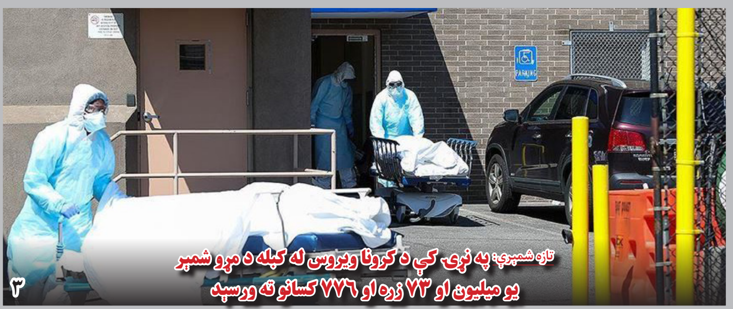
تازه شمېرې: په نړۍ کې د کرونا ویروس له کبله د مړو شمېر یو میلیون او ۷۳ زره او ۷۷۶ کسانو ته ورسېد