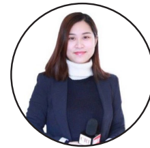
ليکواله: زرينه - د چين ميدياگروپ خبرياله