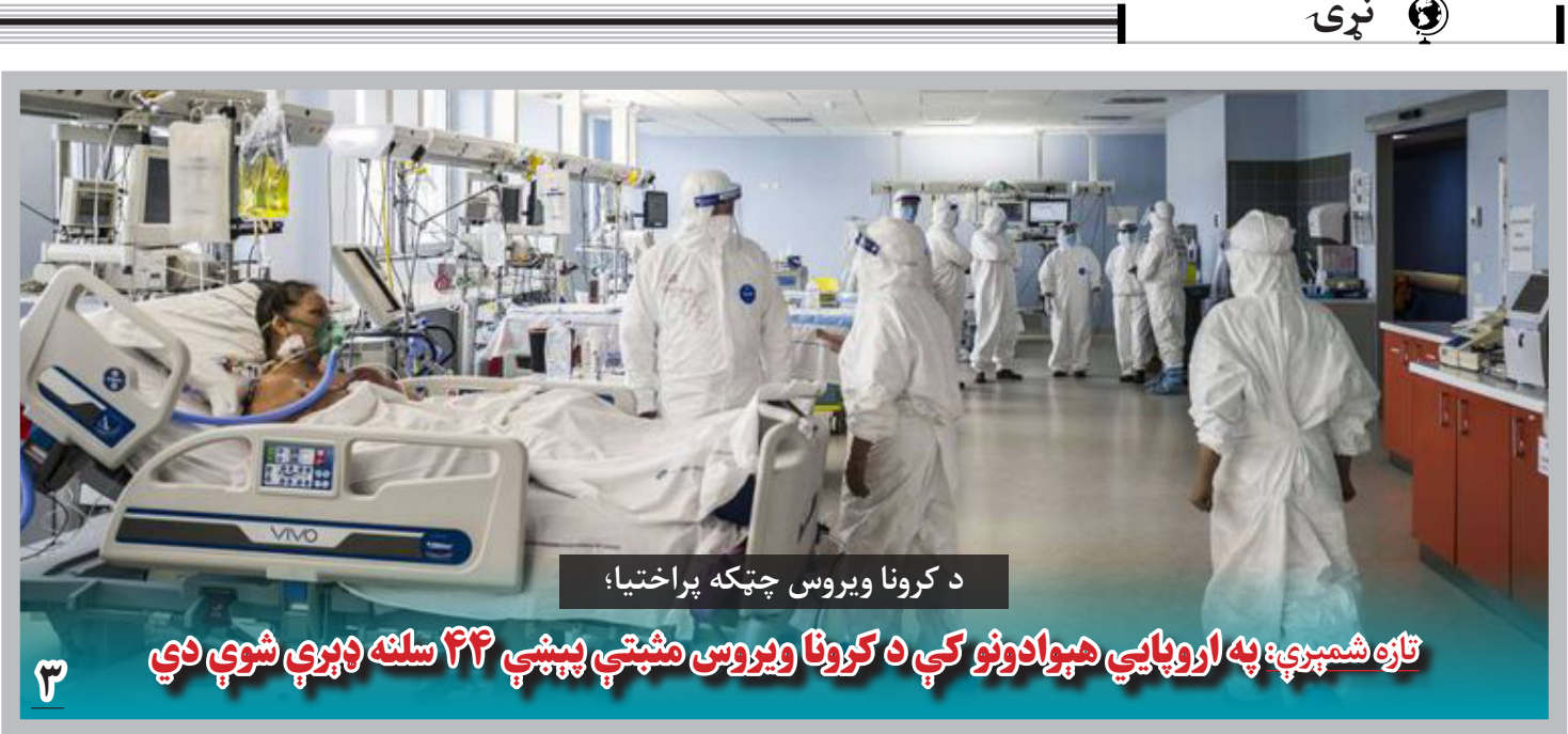
د کرونا ویروس چټکه پراختیا؛ تازه شمېرې: په اروپایي هېوادونو کې د کرونا ویروس مثبتې پېښې ۴۴ سلنه ډېرې شوې دي