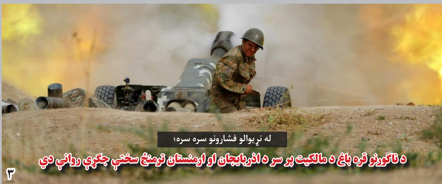
له نړيوالو فشارونو سره سره؛

همچنان موصوف گفت که در پلان امنیتی، تامین امنیت ساحات تجاری و ترانزیتی مهم چون چاه بهار از طریق پل ایریشم بندر ملک و پروژه های بزرگ ملی عام المنفعه بند کمال خان، در اولویت قرار خواهد داشت.